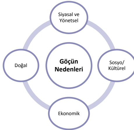
Şekil- 1. Göçün Nedenleri