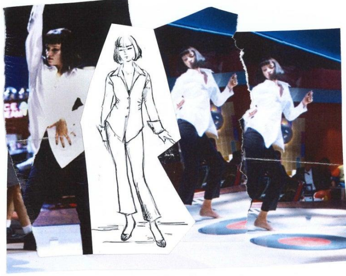
Şekil 4. (Uma Thurman) Mia Wallace simgeleşmiş kostümü, (URL 11).

Son derece şiddet içeren ve izleyenleri rahatsız eden film içindeki mizahla, müziklerle eğlenceli hale gelmiş ve karakterlerin stilize edilmiş görüntüsü ile de seyirciler üzerinde büyük etki yaratmıştır. Her kadın Mia Wallace gibi giyinmek istemiştir. Küt saçları, satışı arttırdığı ojeleri, kısa pantolonu, beyaz gömleği, altın sarısı Chanel babetleri ile onu filmin en kostümleriyle simgeleşen karakteri haline getirmiştir. (Şekil 3). Besty Heimann'ın Uma Thurman için tasarladığı dar ve uzun manşetli beyaz Fransız gömleği ve ges pantolonda 1990'ların minimalist şıklığını görebiliriz (Şenyapılı, 2002:178). Bunun yanı sıra sivri yakalar, büyük manşetler, daraltılmış bel ile bir araya gelince görünüşü dışileştirmiş, mafya babası ve patronun karısı olduğu için ateşli ama dokunulmaz bir karakter yaratılmıştır.