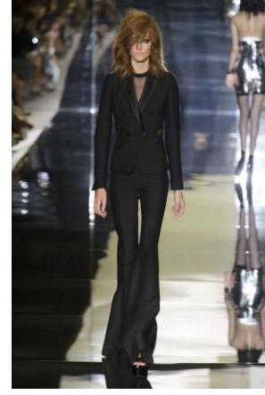
Şekil 10. Tom Ford Tasarımları, Mia Stili Kostümler, (URL 20).