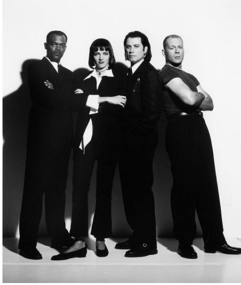
Şekil 11. Film kostümleri, (URL 22).

Filmdeki kadın karakterin dışı görünmesi için seksi kostümler, zengin olduğunu göstermesi için pahalı mücevherler yerine, sade şıklığı gösterdiği için filmin kostümleri simgeleşmiştir. Kostümlerin maskülen atmosferi kadın ve erkek cinsiyetleri arasındaki sınırı kaldırarak melez bir moda formu yaratmıştır. Film gösterime girdikten 20 yıl sonra bile moda dünyasında tekrar tekrar esinlenen minimalist bir tarz yaratmıştır. Abartı, süs ve renkten kaçınan bu tavırda kostümleri ikon haline getirmiştir. Öte yandan ulaşılabilirliği ve günlük yaşamda kolayca kullanılabilirliği nedeni ile kostümler filmin sınırlarını aşmıştır. Sadece beyaz gömlek ve siyah pantolonla simge olunabileceğini ispatlamıştır. Ve filmin birçok sahnesinde bu kostümle görüntülenmektedir. Bir karaktere beyaz bir gömlek ve siyah pantolon giydirmek bir düşünce değildir. Bu modada büyük bir ifade biçimidir. Zamansız bir kombindir ve aynı zamanda moderndir. (Şekil 11) Bir tür kaynak kostüm merkezine haline gelen filmin kostümleri tasarımcıları için çekim noktası olmaya devam etmektedir.