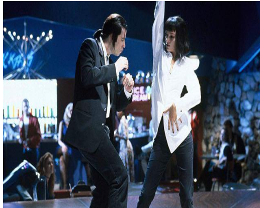
Şekil 3. (Uma Thurman) Mia Wallace, beyaz gömlek kombini, (URL 10).