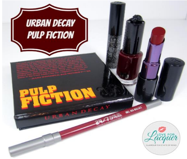
Şekil 5. Filmin simgeleşen nesne, saç, makyaj malzemesi ve kostümleri, (URL 14).