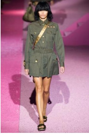
Şekil 8. Marc Jacobs: Mia'nın İkonik Saç Stili, (URL 18).