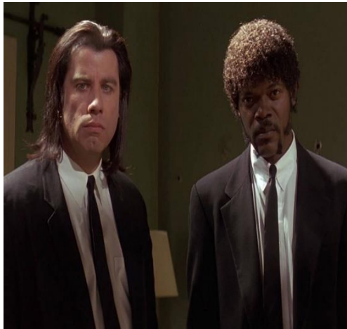
Şekil 7. Pulp Fiction, 90'lar Modasını Yansıtan Gangster Tarzı, (URL 17).

Bu film moda anlamında öncülük yapmış, bele oturan büyük manşetli, büyük yakalı, önü oval kesim gömlek filmde sonra giyilmiş, yine makyaj malzemeleri ve Chanel koyu renk ojesini ve makyaj stili için kozmetik markaları malzemeleriyle birlikte önerilerle tanıtmış, kısa paça pantolonlar yeniden gündeme gelmiştir (URL 16).