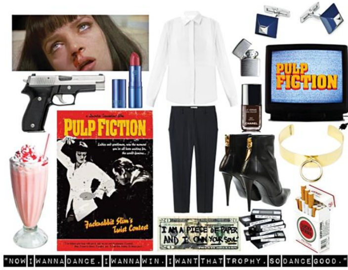
Şekil 6. Filmin simgeleşen nesne, saç, makyaj malzemesi ve kostümleri, (URL 15).

Bu film moda anlamında öncülük yapmış, bele oturan büyük manşetli, büyük yakalı, önü oval kesim gömlek filmde sonra giyilmiş, yine makyaj malzemeleri ve Chanel koyu renk ojesini ve makyaj stili için kozmetik markaları malzemeleriyle birlikte önerilerle tanıtmış, kısa paça pantolonlar yeniden gündeme gelmiştir (URL 16).