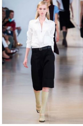
Şekil 9. Jil Sander Tasarımları, Mia Stili Kostümler, (URL 19).