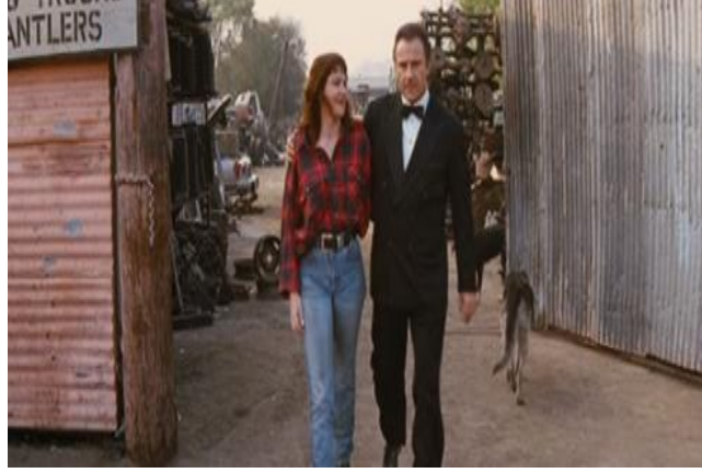
Şekil 2. Pulp Fiction Filmi, 90'lar Modasını Yansıtan Ekose Gömlek. (URL 8)

1994 yılında Quentin Tarantino'nun yönettiği Pulp Fiction (Ucuz Roman) filminin kostüm tasarımcısı Betsy Heimann'dır. Başrol oyuncularında olmasa bile filmin genelinde 90'ların tüm moda görünümleri kullanılmıştır. Denim gömlekler ve ceketler, rahat kesim jeanler, bol takım elbiseler, kabanlar, dönemin saç stilleri, baskılı t-shirtler, gömlek içi t-shirt kullanımı, ekosenin gömlek ve alt grupta kullanılması erkeklerdeki altın takı kullanımları göze çarpmaktadır. (Şekil 2)