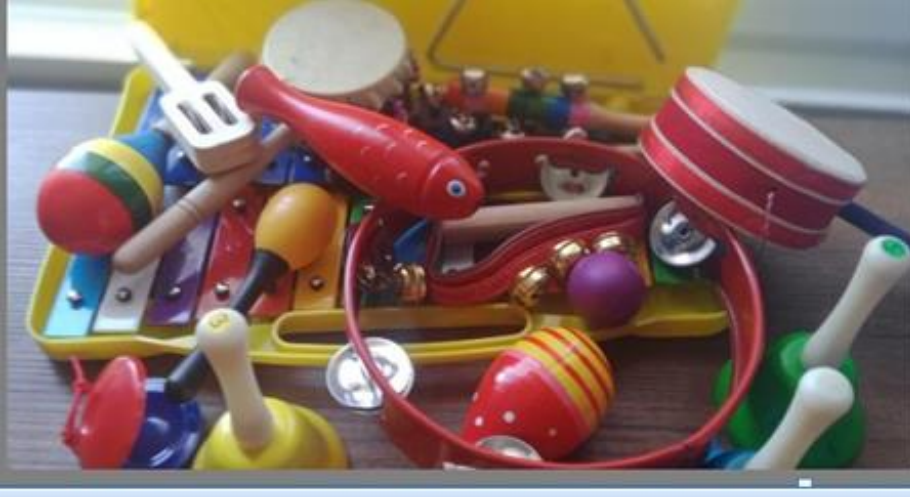
Resim 3. Derste Kullanılan Orff Çalgılarından Örnekler