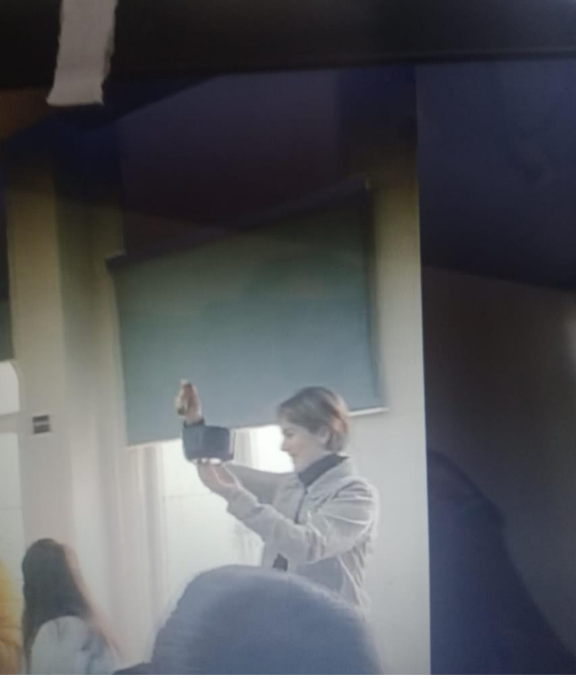
Resim 2. Derse Başlamadan Tibet Çanağının Tınlatılması