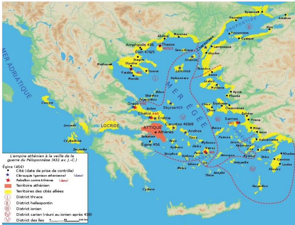
Harita 2: Delos Birliđi, (URL1)