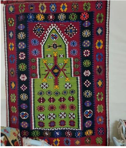
Fotoğraf:42 Basamaklı Tarak Motiflerinden Mihrap Oluşturulmuş Seccade