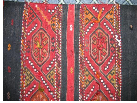
Fotoğraf 20-21 Kilim, Cicim, Zili, Sumak Teknikleriyle Dokunmuş Çuval