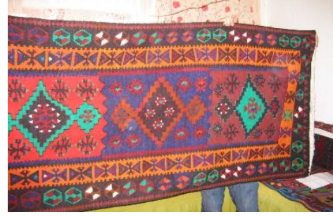
Fotoğraf:29-30 Farklı Renklerle Bölünmüş Zemin Üzerine Göz Motifleri Yerleştirilmiş Kilim Tekniğinde Duvar Yayıgısı