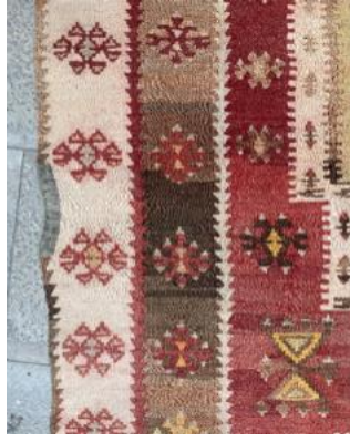
Fotoğraf:15 Kumaş Geçirilerek Sökülen Yerleri Tamir Edilmiş Kilim Detayı