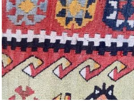
Fotoğraf: 13 Eğri Atkılı, Sarma Kontürlü Tekniklerde Dokunmuş Elibelinde Motifleri ve İlikli Kilim Tekniğinde Dokunmuş Tarak/Parmak Motifleri

Kuruhüyük kilimlerinde; ilikli kilim, eğri atkılı kilim ve sarma kontür teknikleri yaygın kullanılmıştır (Bknz Fotoğraf 13).