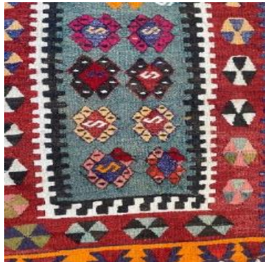
Fotoğraf: 18 Pampal (Gelincik) Çiçeklerinin Ortasında Cicim Tekniği ile Dokunmuş Solucan Motifleri