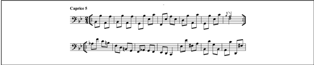
Şekil 5. Caprice 5 Bizzarria (URL-8)

Caprice 5, si bemol majör tonda yazılmış iki zamanlı bir bölümdür. Galligioni albümünde bu bölüm için İtalyanca bizzarria tanımını kullanmayı uygun görmüştür. İngilizcedeki karşılığı bizarre olan bu terim tuhaf , acayip , garip anlamlarına gelir. Sabit bir tempodan ziyade müzikal yürüyüşler bölümün özgür bir tempo anlayışıyla çalınmasına izin verir (Bkz. Şekil 5). Bazı notalarda duraklamalar, bazı notalarda ise süratle melodiyi akıtmak gerekir. Sekizliklerden oluşan bu bölüm ilk okumada kolayca çalınabilmesine karşın, doğru müzikal ifadeyi yaratmak için müzikal analiz yapmak gerekir.