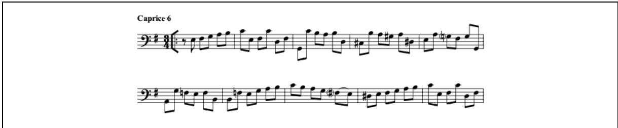
Şekil 6. Caprice 6 Courante (URL-8)

Caprice 6, mi minör tonda üç zamanlı yazılmıştır. Üç zamanlı yapı bize Courante dansını hatırlatır. Tamamı sekizlik notalardan oluşan bölümde armonik yürüyüş dikkate alınarak yapılacak duraklamalar yorumu daha akıcı bir hale getirecektir (Bkz. Şekil 6).