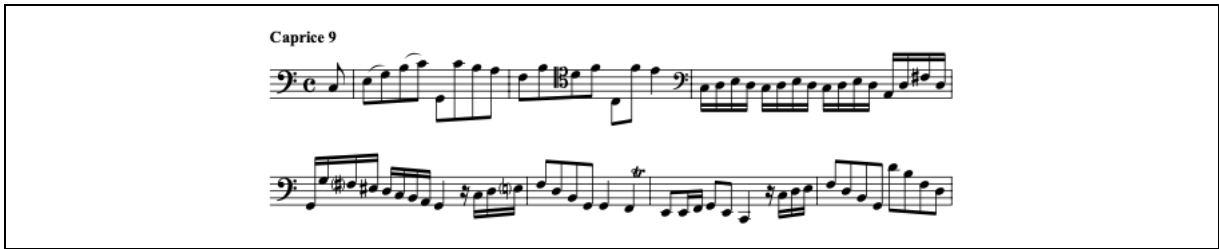
Şekil 9. Caprice 9 Tocatta (URL-8)

Caprice 9, do majör tonda yazılmış bir Tocatta'dır. “Dokunmak anlamına gelen Tocatta dokunuşun hız ve incelikle sergilendiği bir müzik parçasıdır” (Oxford Müzik Sözlüğü, 2012). Eksik ölçü kullanımı ikinci kez bu bölümde ortaya çıkar. Bu bölümdeki müzik yürüyüşünde akorlar, çift sesler ve değişen hızdaki pasajlar ve arpejler virtüözite gerektirir (Bkz. Şekil 9).