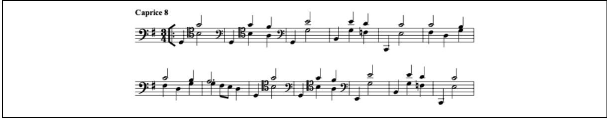
Şekil 8. Caprice 8 Menuet (URL-8)

Caprice 8, sol majör tonda yazılmıştır. Üç zamanlı yapısı ile bir Menuet'dir. Menuet “zarif adımlı incelikli yumuşak bir danstır” (Korlu, 2004). Çift sesler kuvvetli zamanların etkisini artırmıştır (Bkz. Şekil 8). Majör tondaki sergiyi minör tondaki orta kısım izler, bölüm majör tondaki sergiye dönerek sonlanır.