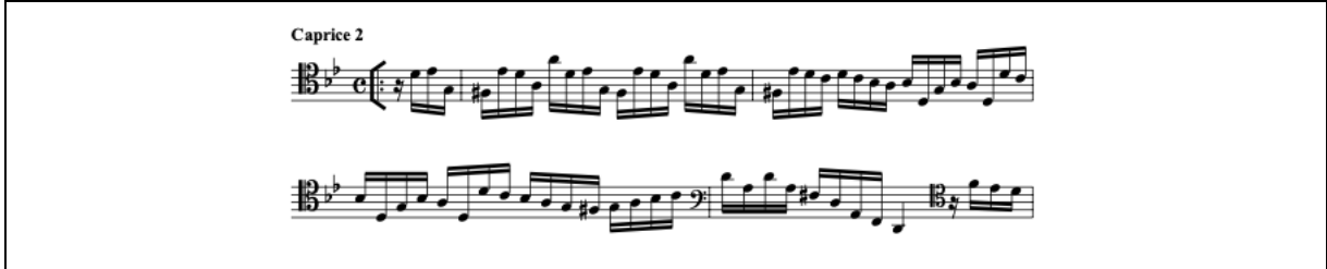
Şekil 2. Caprice 2 Allemande (URL-8)

Caprice 2, sol minör tonda dört zamanlı yazılmıştır. Eksik ölçü ile başlayan ve birbirinden röpriz ile ayrılan iki bölümden oluşması sebebiyle Allemande olduğu söylenebilir. Oxford Müzik Sözlüğü (Kennedy, 2012) “Alman kökenli, genellikle 4 bazen 2 zamanlı olan bir dans” tanımlaması yapmıştır. Allemande 17. yüzyılda ve 18. yüzyıl’ın başlarında çok sık kullanılmıştır. Karakter olarak ciddi ve orta hızdadır, sütün açılış bölümünden sonraki bölümdür (Bkz. Şekil 2). Onaltılık notalar iyi takip ve çeviklik gerektirir.