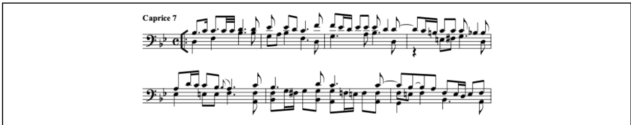
Şekil 7. Caprice 7 Andante (URL-8)

Caprice 7, si bemol majör tonda yazılmış dört zamanlı bir bölümdür. Çift sesler yoğun şekilde kullanılmıştır, bu sebeple entonasyon konusunda dikkat gerektirir (Bkz. Şekil 7). Orta tempoda çalınması yorumcuya armonik yürüyüşleri duyurabilmesi için zaman tanıyacaktır.