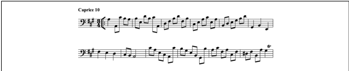
Şekil 10. Caprice 10 Aria (URL-8)

Caprice 10, üç zamanlı ve la majör tonunda yazılmıştır. Galligioni albümünde bu bölüm için aria ifadesini kullanmıştır. Bölüm majör ve minör tonları arasında hızlı gezintiler yapan hafif bir yapıdadır (Bkz. Şekil 10).