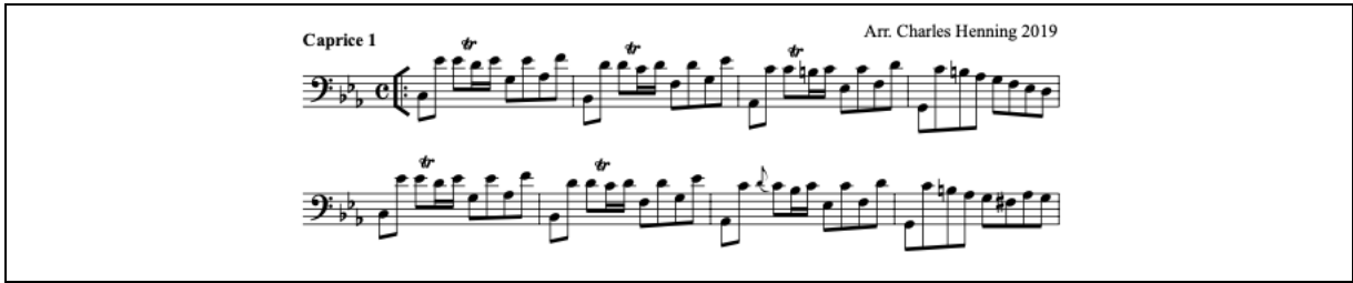
Şekil 1. Caprice 1 Introduction (URL-8)

Caprice 1, do minör tonda yazılmış dört zamanlı bir giriş bölümüdür. 11 Capricci, eserinin açılış bölümüdür ve 11 bölümden oluşan eserin tanıtımı görevini üstlenir. Minör ton melankolik bir atmosfer yaratırken, atlamalı notalarla yapılan armonik yürüyüş ve triller atmosferi destekler. Orta hızda yazılmış bu bölüm yorumcunun müzikal cümlemeleri ortaya çıkarmasını gerektirir (Bkz. Şekil 1).