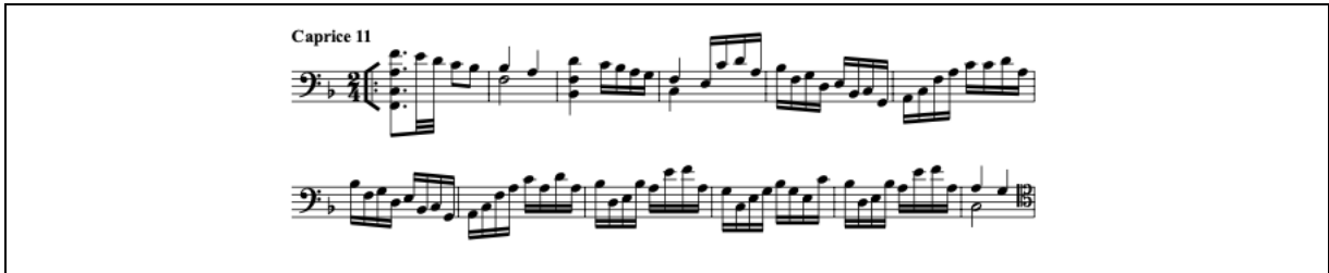
Şekil 11. Caprice 11 Aria da Capriccio-Presto (URL-8)

Caprice 11, iki zamanlı ve fa majör tonda yazılmıştır. Bu bölümde Presto olarak belirtilmiş tempo ve ifade geçişi ve ritimle ilgili göstergeler karşımıza çıkar. Bunlar daha keskin çalmayı gerektiren noktalı onaltılık ve otuzikilik nota kombinasyonlarıdır. İki parçadan oluşan bu bölümde Presto ara bölüm ve keskin ritimli ifadeler yorumcunun virtüözitesini sergilemesine olanak tanır (Bkz. Şekil 11-12).