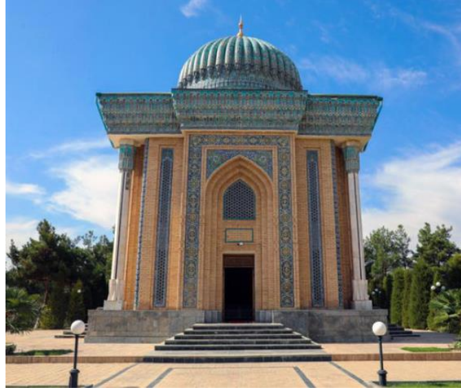
Resim 7. İmam-ı Maturidi Türbesi - Semerkand (URL7)

Büyük hadis alimi İmam Buhari Türbesi Semerkand'da bulunmakta olup, geçmiş dönemlerde çeşitli restorasyonlardan geçmiş, şimdiki halini 1998 yılında almıştır. 10 hektar alanın üzerinde yapılan külliye mantığında yapılan bu yeni anıt kompleksinin merkezinde İmam Buhari'nin türbesi bulunmaktadır. Türbe üzerinde yine turkuaz çinilerle kaplı çift nervürlü soğan tipi kubbe vardır. Beyaz mermerlerle kaplı yapıda mavi turkuaz süslü çinilerin yanı sıra yapıyı enlemesine kaplayan bir kuşak yazısı da kullanılmıştır.