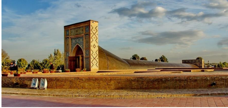
Resim 5. Uluğ Bey Rasathanesi Taç Kapısı – Semerkand (URL5)

Bu bağlamda Uluğbey Rasathanesi, İran'ın Meraga şehrindeki Meraga Rasathanesi esas alınarak restore edilmiştir. Rasathanenin giriş kapısı çeşitli yıllarda yenilenerek Timur mimarisindeki taç kapılarından esinlenilerek yapılmıştır. Aynı zamanda rasathanenin yanına Uluğ Bey adına bir hatıra müzesi oluşturulmuştur. Yapı, Timurlu dönemine birebir benzemektedir. Dış mekan oluşturan yapıların yüzeylerinde turkuaz çiniler ağırlıkta olup geometrik kompozisyonlarla süslenmiştir.