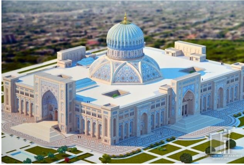
Resim 9. Özbekistan İslam Medeniyeti Merkezi

Taşkent'te Emir Timur'un doğumunun 660. yılı olan 1996 yılında açılışı yapılan Emir Timur Devlet Tarihi Müzesi, Sovyetler Birliğinin dağılmasından sonraki süreçte yapılan ilk yapıdır. Şehrin merkezinde bulunan Emir Timur meydanına konuşlandırılan yapı, çift nervürlü mavi çinili kubbesi bulunmakta olup tarihi yapılara benzerliği sadece bu kubbedir.