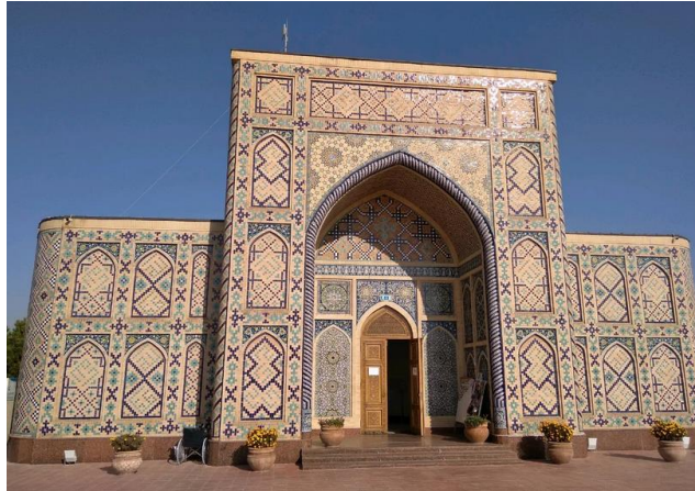
Resim 6. Uluğ Bey Müzesi - Semerkand (URL6)

İmam Maturidi Türbesi, Sovyetler döneminde yok edilen Semerkand'daki Çakerdize kabristanının bulunduğu bölgede yapılan kazılar neticesinde bulunan kabrin üzerine 2005 yılında yapılmıştır. Yapı Timur dönemi yapılarında görülen çini kaplanmış soğan tipi kubbe ile kare planlı olarak tasarlanmıştır. Sırsız tuğla üzerine çift nervürlü turkuaz süslü çinilerle bezenmiş olup geniş bir bahçe içerisinde konumlandırılmıştır.