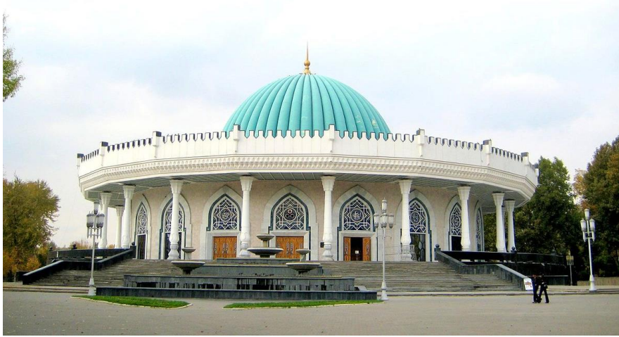
Resim 10. Emir Timur ve Devlet Tarihi Müzesi

Taşkent'te Emir Timur'un doğumunun 660. yılı olan 1996 yılında açılışı yapılan Emir Timur Devlet Tarihi Müzesi, Sovyetler Birliğinin dağılmasından sonraki süreçte yapılan ilk yapıdır. Şehrin merkezinde bulunan Emir Timur meydanına konuşlandırılan yapı, çift nervürlü mavi çinili kubbesi bulunmakta olup tarihi yapılara benzerliği sadece bu kubbedir.