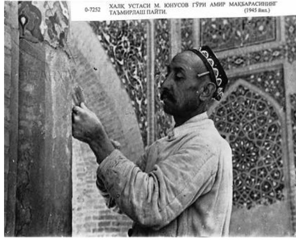
Resim 3. Gur-i Mir Türbesi Restorasyonundan- 1945

II. Dünya Savaşı'nın başlamasını müteakip 1943'te Uzkomstaris kaldırılarak SSCB Halk Komiserliğine bağlı Mimarlık Bölümü kurulmuş, mimari anıtların korunması buraya devredilmiştir. Bu bölüm aynı zamanda şehir ve köylerdeki konut ve ekonomik yapıların imar edilmesi ile de ilgilendiği için birçok tarihi eser yok olmuştur (Ostonov vd., 2021). Belli bir plan dahilinde Semerkand tarihi merkezlerin etrafına eğitim kurumları, kültür sarayları ve sinema salonları ile çok katlı binalar yapılmıştır. Buhara'da ise şehrin tarihi surları yıkılarak tuğla malzemesi olarak kullanılmıştır (Ostonov vd., 2021).