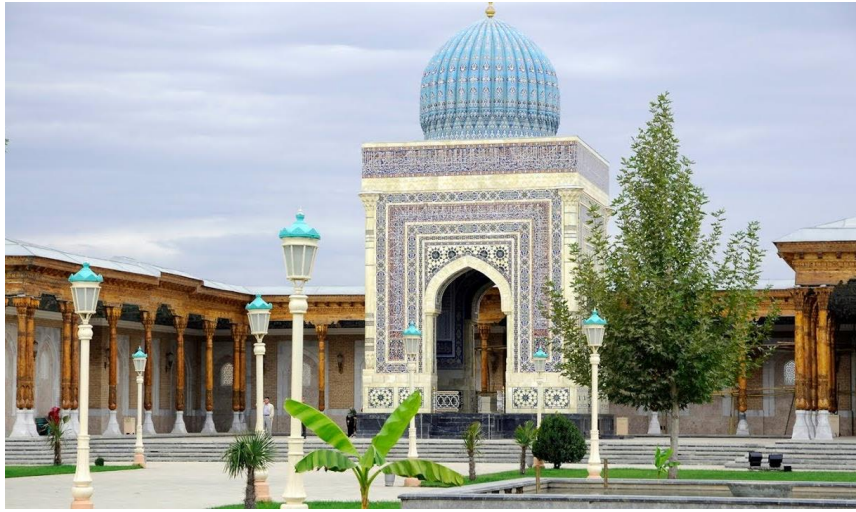
Resim 8. İmam Buhari Külliyesi - Semerkand (URL8)

Büyük hadis alimi İmam Buhari Türbesi Semerkand'da bulunmakta olup, geçmiş dönemlerde çeşitli restorasyonlardan geçmiş, şimdiki halini 1998 yılında almıştır. 10 hektar alanın üzerinde yapılan külliye mantığında yapılan bu yeni anıt kompleksinin merkezinde İmam Buhari'nin türbesi bulunmaktadır. Türbe üzerinde yine turkuaz çinilerle kaplı çift nervürlü soğan tipi kubbe vardır. Beyaz mermerlerle kaplı yapıda mavi turkuaz süslü çinilerin yanı sıra yapıyı enlemesine kaplayan bir kuşak yazısı da kullanılmıştır.