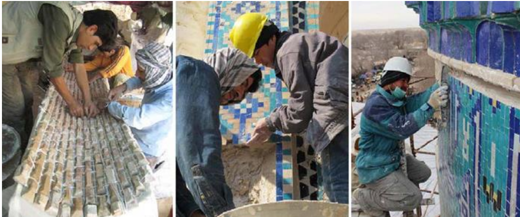
Resim 4. 1991 Yılı Sonrası Restorasyon Çalışmaları. (URL4)

1991'deki SSCB'nin dağılıp ülkelerin bağımsızlıklarını ilan etmesinden sonra Özbekistan, Marksist-Leninist komünist mirası reddetmiş, onun yerine Timurlu kolektif hafızasını oluşturmak adına Timur imajını geliştirmiştir. Taşkent, Semerkand ve Şehrisebz'de yapılmış 3 adet farklı Emir Timur Heykeli bulunmaktadır. Özbekistan, geçmişten günümüze kadar oluşan bir restorasyon geleneği ve yeni teknolojik gelişmeler sayesinde halen restorasyon ve koruma faaliyetlerini halen sürdürmektedir.