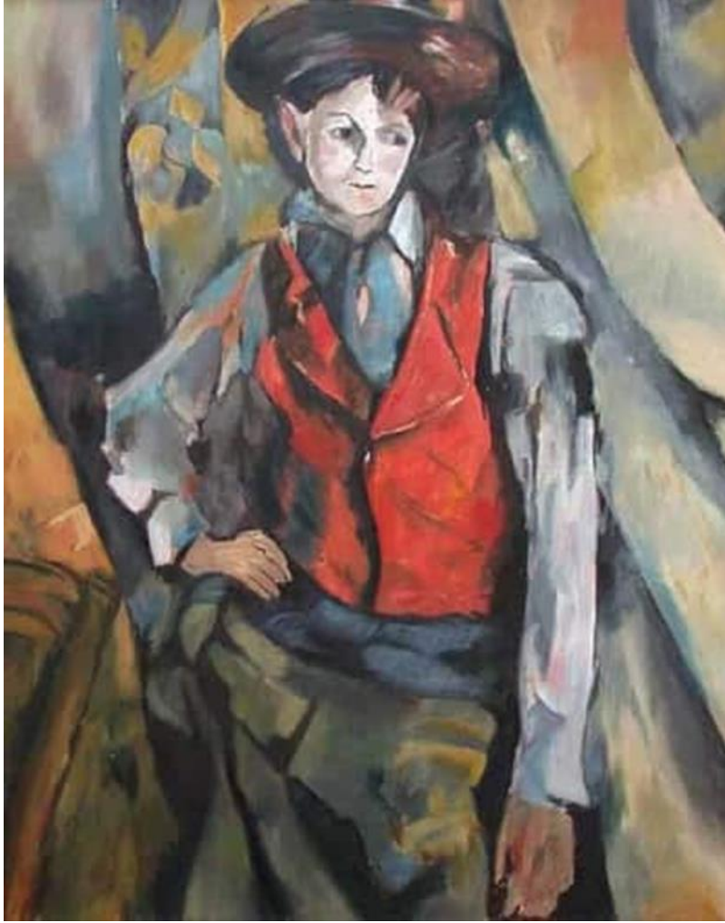
Resim 6. Paul Cezanne, Kırmızı Yelekli Çocuk, 1888–1890

1839'da bir şapka tüccarının oğlu olarak dünyaya gelen Paul Cezanne'ın sanat hayatı dört farklı bölüme ayrılmıştır. Bu dönemler Erken Dönem (1872 öncesi), İzlenimci Dönem (1872-1882), Sentez Dönemi (1883-1895) ve Geç Dönem (1895-1906) şeklinde incelenmektedir. Cezanne'ın erken dönem tablolarında koyu renkler hakimdir. Sanatçı bu dönem tablolarının birçoğunu yok etmiştir. Cezanne'ın ikinci yani izlenimci dönemi Pissarro ile tanışmasından hemen sonra başlamıştır. Sanatçının doğaya yönelik çalışmalar yapmaya başlaması, Renior gibi kırsala taşınmasına yol açmıştır. Sanatçı tablolarında siyah kontürler ve koyu renkler kullanmaktan vazgeçmiş, parlak ve sıcak renkler kullanarak resimlerini oluşturmuştur. Bu akımla beraber spatula kullanmaktan vazgeçmiş tablolarında fırça kullanmaya başlamıştır. İzlenimcilerin düzenlediği sergiye katılan Cezanne da eleştirilerden nasibini almıştır. Birçok sanatçı sergideki resminin kaldırılmasını istemiştir.