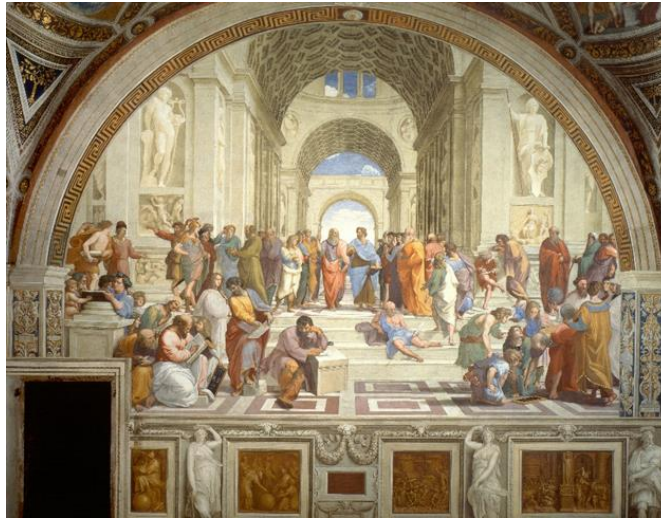
Resim 1. Raffaello, Atina Okulu, 1509-1511