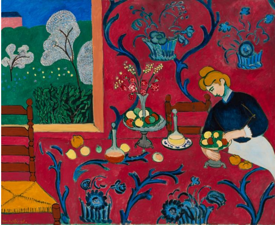
Resim 7. Henri Matisse, Kırmızı Oda,1908

Henri Matisse 'in empresyonizm ve Van Gogh' un eserleriyle tanışması sanat hayatında köklü değişiklikler olmasını sağlamıştır. Tarzını tam olarak değiştiren sanatçının Pissarro'nun tavsiyesi ve Cézanne'in eserleri ile tanışması renk ve üslup anlayışında köklü değişikliklere gitmesinde rol oynamıştır. Fovizm üslubunun hakim olduğu çalışmalara on yıl kadar devam etmiştir. Resimlerinde renklerin özne ile uyumsuz olması duyguların dile getiriminin sembolik bir aracı haline gelmiştir. Sanatçının doğayı temel alması Empresyonistlerin başlattığı akımın Matisse tarafından hala sürdürülüyor olmasının bir göstergesi olmuştur.