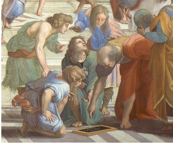
Resim 4. Raffaello, Atina Okulu

Raffaello bu tablosunda ana merkeze yerleřtirdiđi figürlerin kıyafetlerinde kırmızı rene gönderme yapmıştır. Önem derecesine göre figürler diđer figürlerden kıyafetlerinin rene ile ayrılmışlardır