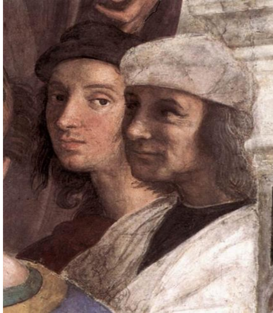
Resim 3. Raffaello, Atina Okulu

Ayrıca tabloda birçok ilk çağ filozofu yer almıştır. Leonardo da Vinci, Platon figürü için, Michelangelo ise Heraklitos figürü için modellik yapmaktadır. Raffaello ise en sağda alt basamakta resmin dışına bakmaktadır.