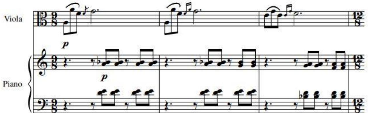
Şekil 7. Viyola ve Pişano için Sonat, 3. Bölüm, 1-3. Ölçüler.

Hocalı Senfonik Şiir adlı eserini 2015 yılında bestelemiştir. Karabağ olaylarını ele aldığı bestesinde acıları unutmama ve gelecek nesillere aktarma misyonunu taşımıştır. 1920 yılında Rusların Azerbaycan'ı işgali ile bestecinin ailesi büyük acılar çekmiş, bu acılardan doğan melodiler Bey kızı olan babaannesinin öğrettiđi ninni motifini kullanmıştır. Bu motif, her şeyini kaybetmiş Karabağlıların derin hüznün ve çaresizliğini tasvir etmektedir (Bkz. Şekil 8). Ayrıca eserde Mors alfabesi vurmali çalgılardan olan üçgen zil ile