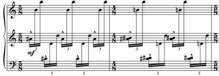
Şekil 5. Pişano için Bayatı No. 3, 1. Ölçü.

2010 yılında viyola ve pişano için yazdığı sonatta Karabağ konusu ele alınmıştır. Savaşın getirdiđi acılar hüznün ve çaresizlik eserin ana motifine dönüşmüştür. Sonatın 2. bölümünde 1983 yılında Azerbaycanlı şair Sabir'in yazmış olduđu "Millət necə tarac olur olsun, nə işim var?!" ("Millet nasıl talan olur olsun ne işim var?") başlıklı şiirinin sözlerinden yazdığı Lied'dinden alıntı kullanmıştır (Bkz. Şekil 6). Besteci bu sözleri kullanarak insanların duyarsızlığı ve bencilliđine karşı duruş sergilemiştir. Eserin 3. bölümünde ise savaşın getirdiđi kayıplardan doğan üzüntü konu edilmiştir (Bkz. Şekil 7).