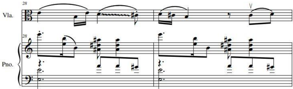
Şekil 6. Viyola ve Pişano için Sonat, 2. bölüm, "Millət necə tarac olur olsun, nə işim var?!" teması, 28-29. Ölçüler.

2010 yılında viyola ve pişano için yazdığı sonatta Karabağ konusu ele alınmıştır. Savaşın getirdiđi acılar hüznün ve çaresizlik eserin ana motifine dönüşmüştür. Sonatın 2. bölümünde 1983 yılında Azerbaycanlı şair Sabir'in yazmış olduđu "Millət necə tarac olur olsun, nə işim var?!" ("Millet nasıl talan olur olsun ne işim var?") başlıklı şiirinin sözlerinden yazdığı Lied'dinden alıntı kullanmıştır (Bkz. Şekil 6). Besteci bu sözleri kullanarak insanların duyarsızlığı ve bencilliđine karşı duruş sergilemiştir. Eserin 3. bölümünde ise savaşın getirdiđi kayıplardan doğan üzüntü konu edilmiştir (Bkz. Şekil 7).