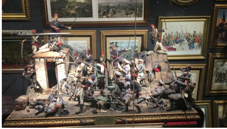
Resim 12: "Kırım Savaşı Sivastopolun Düşüşü 1855" Grup: Diorama Konum: I. Kat

1. Dünya Savaşı'nda (Resim 11) Türk-Alman ortak yapımı olan bu vagona uçak motoru takılarak oluşturulan bu araç tarihteki ilk hızlı tren projesi olarak düşünülebilecek bir özelliğe sahiptir.