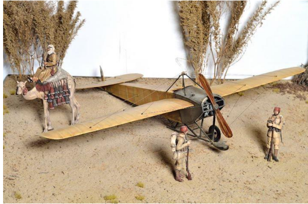
Resim 9: “İlk Uçak ve Son Durak Trablusgarp 1912” Grup: Diorama Konum: II. Kat

Müze de yer alan Türk ve dünya tarihi akışında oldukça etkili olan (Resim 8) 29 Mayıs 1453 de 54 günlük bir kuşatma ile fethedilen siyasi coğrafi ve dini yönden büyük bir öneme sahip İstanbul'un fethi dioraması.