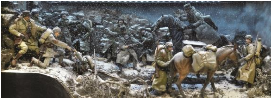
Resim 10: “Sarıkamış” Grup: Diorama Konum: II. Kat

29 Eylül 1911-18 Ekim 1912 tarihinde yapılan (Resim 9) Trablusgarp Savaşı ve dünya tarihinde ilk kez İtalyanlar tarafından keşif uçuşunun yapıldığı hava saldırısının gerçekleştirildiği savaş olması ve ilk uçağın düşürüldüğü diorama.