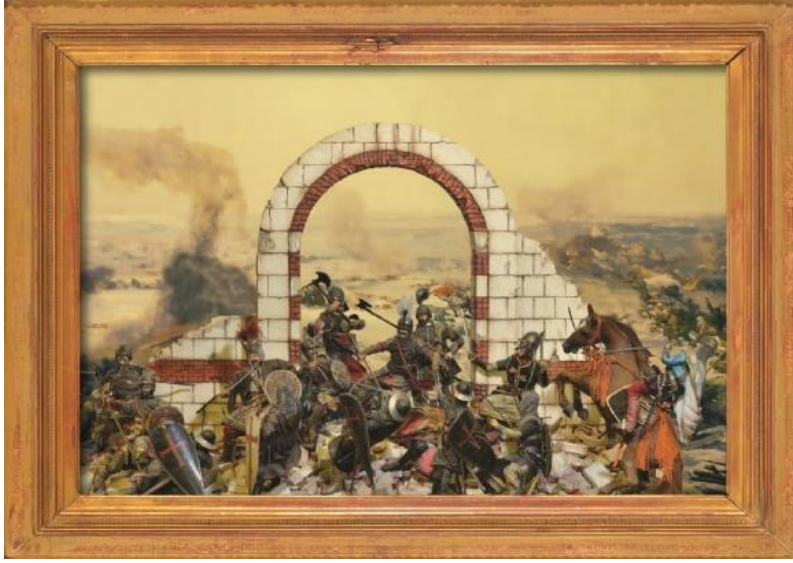
Resim 8: “Yeni Çağın Başlangıcı Fetih 1453” Grup: Diorama Konum: Zemin Kat

Dünyanın kaderini belirleyen tarihi olaylar, savaşlar, dönüm noktaları, başlangıçlar ve sonlar Selçukludan Osmanlıya Kurtuluş Savaşı'ndan dünya savaşlarına kadar hatırlatma tanıkları müzede ziyaretçileri ile buluşmaktadır. Dönemlere ait silahlar, madalyalar, bayraklar, tablolar mataralar, maket uçaklar, trenler gemiler, fotoğraflar ve dioramalar (üç boyutlu tasarımlar) tarihi yeniden hatırlatma görevi ile müzede sergilenmektedir.