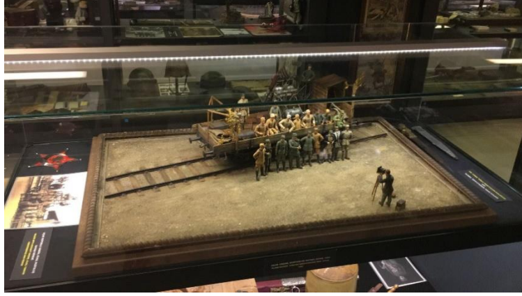
Resim 11: İlk Uçak Vagon-Türk Alman Yapımı Grup: Diorama Konum: II. Kat

Sarıkamış'ta kuşatma harekâtı (Resim 10) 90.00 kişilik bir kuvvetle 22 Aralık 1914 tarihinde, eksi 25 derecede, bir buçuk metre kar altında, ortalama iki üç bin metre yükseklikte çetin kış koşulları altında Allahüekber Dağları'nı aşmaya çalışan Türk askerlerinin Kafkas Cephesi'nde büyük umutlarla başlayan taarruz harekâtının 90.000 şehit ile sonuçlandığı diorama.