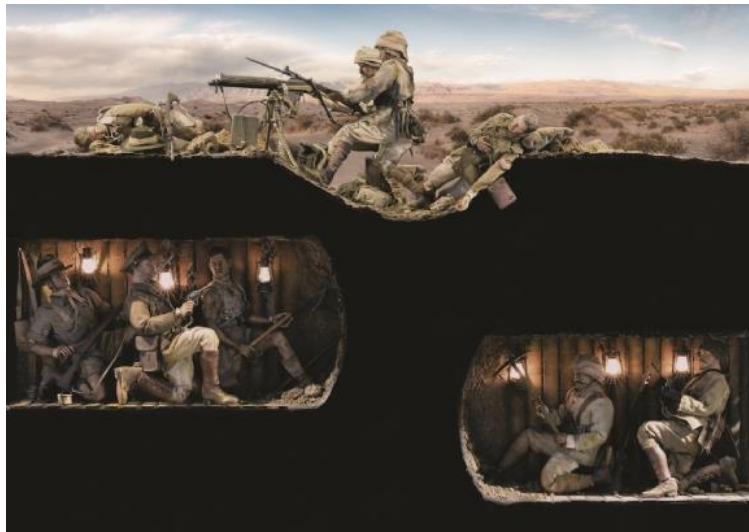
Resim 13: "Yukarıdakiler ve Aşağıdakiler Çanakkale 1915" Grup: Diorama Konum: II. Kat

1853-1856 tarihleri (Resim 11) arasında Osmanlı Devleti ve Rusya arasında gerçekleşen Kırım Savaşı dioraması.