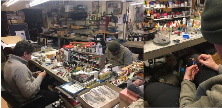
Resim 7: “Hisart Canlı Tarih ve Diorama Müzesi Diorama Atölyesi” Kaynak: Url 7

“Kurucusu Nejat Çuhadaroğlu’nun küçük yaşlarda başlayan resim, heykel ve maket yapma tutkusu, seneler içerisinde büyüyerek önce koleksiyonerliğe ve ardından müzeciliğe kadar uzanan, zahmetli fakat bir o kadar da keyifli bir uğraş haline gelmiştir (Url 6).”