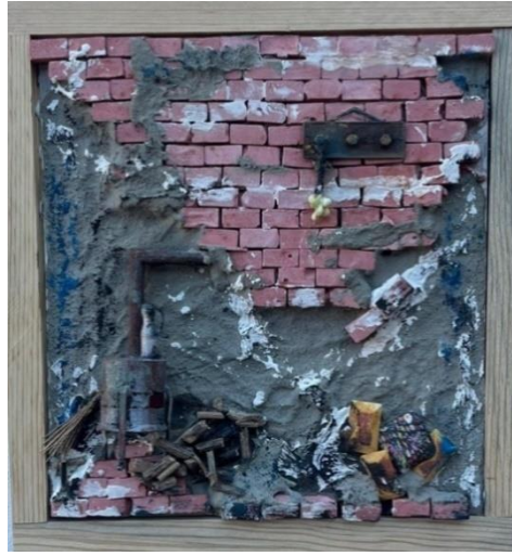
Resim 5: “Yadigâr” 30X30 cm, 2022

(Resim 5) Yaşanmışlıkların izini taşıyan yaşayanların bırakıp gittiği bazılarının müzelerde bazılarının terkedilmiş alanlarda bıraktığı eşyalar ve bu eşyaların geride kalanlarda bıraktığı izleri konu edinir. Bireysel hafızaya kazınan fotoğraflar bir nevi kültür aktarımı misyonu ile geçmiş yaşamlara tanıklık eden nesnelere ve mekânlar diorama tekniği ile yeniden üretilir.