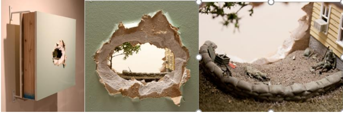
Resim 3: Thomas Doyle Holdout Mixed media / 18.25 x 19 x 4.5 inches / 2014

Thomas Doyle küçük bir ölçekte işlenen anların özel yoğunluğu, (Resim 3) izleyiciyi içine çekip bir müze vitrinine veya oyuncak bebek evine bakarken hissedilen mahremiyete izin verir. Kaos, tehlike ve özlemlerle çevrelenmiş olsalar da, figürlerin yüzleri çok az duyguyu ele vererek izleyicileri bu potalarda ve ortaya çıkardıkları duygu ve anılar karmaşasında kendilerini kaybetmeye davet eder (Url 3).