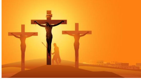
Şekil 2: Hristiyanlık Dinin Sembolü Hac (Kutsalkıtap, 2023)