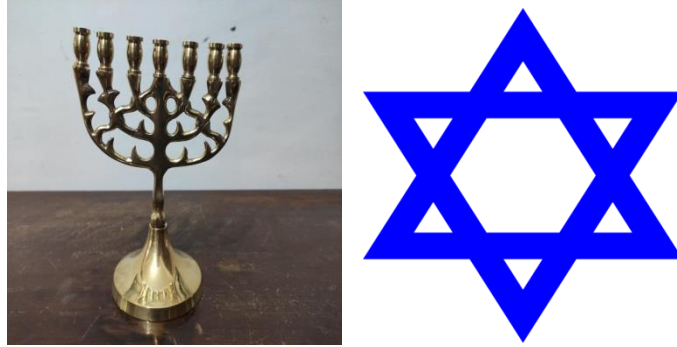
Şekil 1: Yedi kollu Şamdan ve Altı Köşeli Yıldız (wikipedia, 2023).

Yahudiliğin temel özelliklerine kısaca ifade edecek olursak; Seçilmişlik: Yahudilikte seçilmişlik inancı en önemli özelliklerindedir. Kendilerini tanrı tarafından seçilmiş millet olarak tanımlarlar. Ahit: Bu bin bir nevi “ahit” dini olarak kabul edilir. Ahit, Yahudilikte Tanrı ile İsrailoğulları arasındaki antlaşma yapıldığını gösteren kanundur. Tanrı, dönem dönem insanlarla ahit yani antlaşma yapmıştır. Kutsal Toprak: Yine Yahudilikte, tanrının seçtiği bu millet için onlara vadettiği kutsal topraklar olduğunu kabul eden bir dindir. Tanrı tarafından kendilerine seçip verilen toprakların ise Filistin toprakları olduğunu iddia ederler. Mabet: İbadet ettikleri kutsal saydıkları yerlere verilen isimdir. Kutsal olan şeylerle burada karşılaştıklarına inanırlar (Serdar ve Murat, 2017).