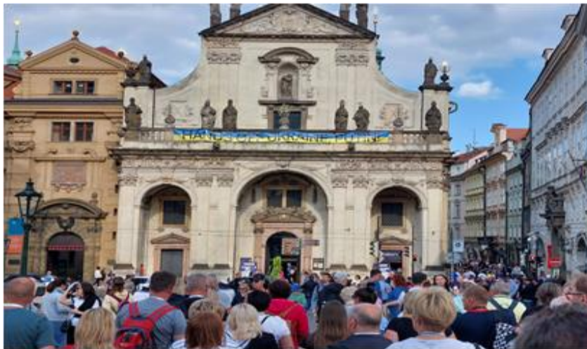
Şekil 1: Prag'ın Kraliyet Yolu Bölgesi'nde Aşırı Turizm Sonucu Oluşan Kalabalık Kaynak: Yarkıcı, S. (2023).

Aşağıda bulunan görsellerde; Çekya'nın Prag şehrinde 2023 yılı yaz sezonunun başlamasıyla oluşan turist akınları gösterilmektedir. "Kraliyet Yolu" olarak bilinen turistlerin uğrak noktası ve "Charles Köprüsü (Karlův Most)" bölgesinde aşırı turizm sonucunda oluşan kalabalıklara ait görseller Şekil 1 ve Şekil 2'de yer almaktadır.