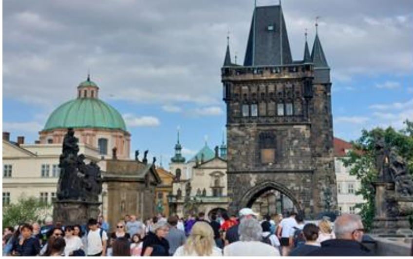
Şekil 2: Prag'ın Charles Köprüsü ( Karlův Most ) Bölgesi'nde Aşırı Turizm Sonucu Oluşan Kalabalık

Prag Şehir Turizmi (2019) Yıllık Raporlarına göre; Prag, tarihinde ilk kez 8 milyon ziyaretçi sınırını aşmış ve önceki yıllarda olduğu gibi rekor sayıda misafir ve geceleme sayısına ulaşmıştır (Prague City Tourism, 2019). Aşağıda bulunan 2014-2019 yılları arasındaki Çekya'nın Prag şehrine ait toplam ziyaretçi (turist) sayısı ve geceleme sayısı (milyon olarak) detaylı şekliyle grafik üzerinde gösterilmektedir.