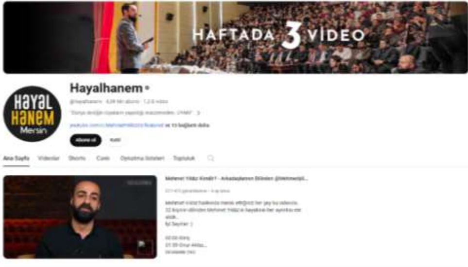
Görsel 1. Hayalhanem YouTube ana sayfası (youtube.com/@hayalhanem, 2013) Youtube.com/@hayalhanem

Sanal dinî cemaatler, dağınık halde bulunan cemaat mensuplarının zaman ve mekândan bağımsız olarak aynı anda ve ortamda iletişim kurmalarına imkân sağlaması, iletilecek mesajın anında kayıt altına alınabilmesi, kimliğin gizlenip açık edilebilmesi gibi yönleriyle geleneksel cemaatlerden ayrılmaktadır. Ayrıca, geleneksel cemaatlerde topluluğa önderlik eden kişi (mürşid), bu unvanı manevî olarak almaktadır ve ilahi ilhamlarla cemaat üyelerine yol göstericilik yaparak tebliğde bulunmaktadır. Ancak günümüzdeki sanal dinî cemaat yapılanmalarında yol göstericilik, tebliğ ve irşat vazifesi sanal dinî cemaatin kanaat önderi -lider ya da star da denilebilir- tarafından yapılmakta ve bilginin aktarılmasından öteye geçememektedir. Sadece müntesiplerinin manevî hayatlarını güçlendirici ya da gündelik yaşama dair problemlerin çözümü noktasında sürekli yeni içerikler oluşturarak mensuplarının dinî motivasyonlarını canlı tutmaya çalışmaktadırlar. Tam da bu noktada Çamdereli (2018), “Medyatik din, ürettiği simülasyon dinsel gerçeklik ve dayattığı toplumsal kabulden ötürü gerçek din değildir. Medyada futbol gibi, bir müzik gibi, bir sağlık gibi popüler kültür ürünü olarak dinin konumu diğer popüler ürünlerin konumu gibi sıradandır” (s. 23-24) diyerek medya üzerinden dinî söylem geliştirenlerin popüler kültürün bir parçası olmaktan öteye gidemeyeceklerine vurgu yapmıştır.