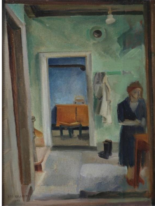
Görsel 2: Ahmet Zeki KOCAMEMİ “Oda İçi-Sofa” (Sanatçının Evi), 1949, T.Ü.Y.B.,55 x 39 cm.