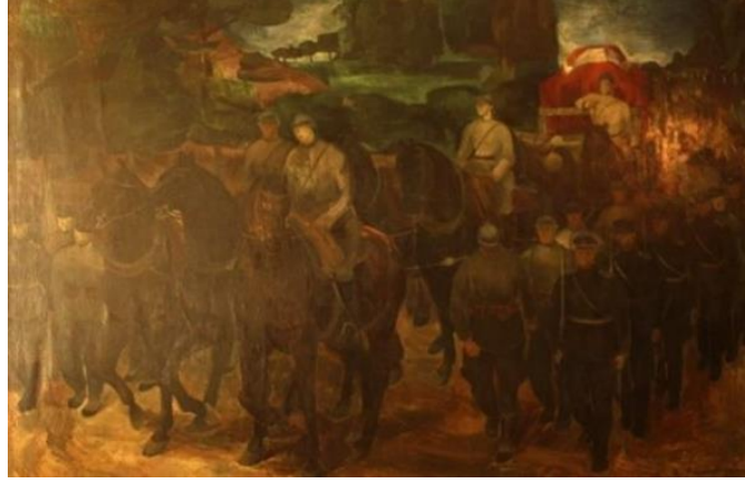
Görsel 3: Ahmet Zeki Kocamemi, “Atatürk’ün Cenaze Töreni (Alayı)”1939, T.Ü.Y.B.,148x250 cm.