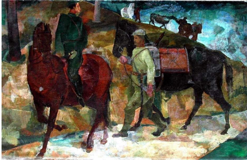
Görsel 1: Zeki Kocamemi "Mekkare Erleri"1935, Tuval Üzerine Yağlıboya, 123.5x195.5 cm.