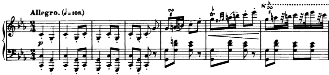
Şekil 1. F. Chopin “Rondo Op. 1” Do minör. Kaynak: Friedrich Chopin’s Werke Band VII

“Rondo Op. 1” (Şekil 1), Chopin’in gençlik dönemine ait, virtüözite gerektiren, dinamik ve teknik açıdan dikkat çekici bir yapıdadır. Teması genellikle hızlı bir tempoda başlar ve kontrastlı pasajlarla gelişir. Ritmik çeşitlilik ve melodik zarafet bu eseri tanımlar.