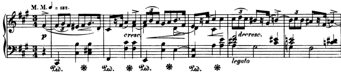
Şekil 2. F. Chopin “Mazurka Op. 6 No. 1” Fa diyez minör Kaynak: Friedrich Chopin’s Werke Band III

Chopin’in “Mazurkalar”ı, Polonya halk danslarının karakteristik unsurlarını barındırmaktadır. “Op. 6 No. 1” (Şekil 2), halk müziğinin dans ritimlerini sofistike bir romantik dil ile birleştirir. Bu eser, temposuyla duygu yoğunluğu ve dramatik ifade arasında dengeli bir ilişki sunmaktadır.