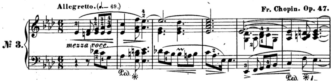
Şekil 6. F. Chopin Ballade Op. 47 No. 3 La bemol majör

Chopin, diğer romantik bestecilerin aksine, eserlerine tanımlayıcı başlıklar koymaktan kaçınmayı tercih etmiştir. Müziğinde programatik imalara yer vermemiş, bunun yerine eserlerine genel form isimleri vermeyi seçmiştir. Bu başlıklar arasında vals, mazurka, polonez, noktürn, scherzo, prelüd, impromptu, ballad (Şekil 6), sonat ve konçerto gibi formlar bulunmaktadır. Bu yaklaşım, Chopin'in müziğinin özünü daha soyut bir şekilde ifade etmesine olanak tanımış ve dinleyicinin eserin duygusal derinliğine odaklanmasını sağlamıştır.