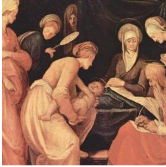
Resim 1. Vaftizci Yahya’nın Doğuşu ve Adının Konulması - Jacopo Pontormo (1526), Florence, İtalya

Yahya’nın doğumunun sekizinci günü, komşular ve akrabalar çocuğun sünnetine geldiler ve ona Zekeriya adını koymak istediler. Anası ise çocuğun adının Yahya olacağını söyledi. Babasına sordular. Zekeriya konuşamadığı için bir levha istedi ve üstüne “ adı Yahya’dır ” yazdı. Ve o anda dili çözölen Zekeriya, Tanrı’ya şükrederek dua etmeğe başladı (Cömert, 2006: 178).