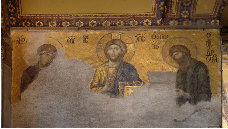
Resim 7. Deisis Kompozisyonu, Ayasofya Müzesi

Resmi önemli kılan diğer bir ayrıntı ise SFUMATO tekniğinin etkin bir şekilde kullanılmasıdır. Bu teknik ile geçişler arasında görülmemiş bir estetik elde etmeyi başarmıştır.