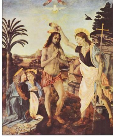
Resim 2. İsa'nın Vaftiz Edilişi – Leonardo Da Vinci (1472), Floransa, Uffizi Gallery

Vaftizci Yahya, İsa'yı Şeria Irmağının sularında vaftiz ediyor. İsa'nın başının üzerinde bir el beyaz güvercin bırakıyor. Bu onun barışı ve huzuru getireceğini, Tanrı ruhunun İsa'nın üstüne konduğunu simgeliyor. Resmin hemen sağ tarafında vaftizci Yahya vardır, o da elinde Hristiyan haçı bulunan bir asa tutuyor ve diğer tarafta diz çökmüş bir kadınla çocuk duruyor. Hepsinin başında yine hale vardır.