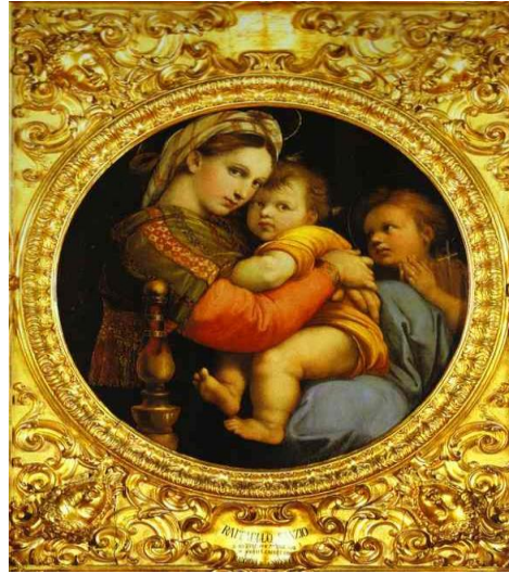
Resim 4. Madonna Della Sedia (İskemlede Oturan Meryem) – Rafaelo (1514)