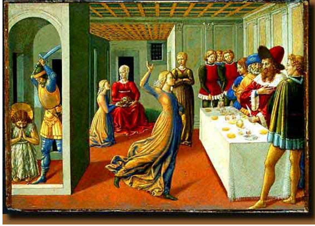
Resim 5. Salome'nin Dansı ve Yahya'nın Başının Vurulması – Benozzo Gozzoli, Washington, National Gallery

şimdi, bir tepsi üzerinde Vaftizci Yahya'nın başını ver” dedi. Kral buna çok üzüldüyse de, konuklarının önünde içtiği anttan ötürü bu dileğin yerine getirilmesini buyurdu. Zindana gönderilen bir asker Yahya'nın başını keserek getirdi ve bir tepsi içinde Salome'ye verildi, tepsiyi annesine götürdü. Yahya'nın öğrencileri gelip cesedi aldılar ve gömdüler, sonra da gidip İsa'ya haber verdiler (Markos, 6: 14-29; Luka, 9: 7-9, URL6).